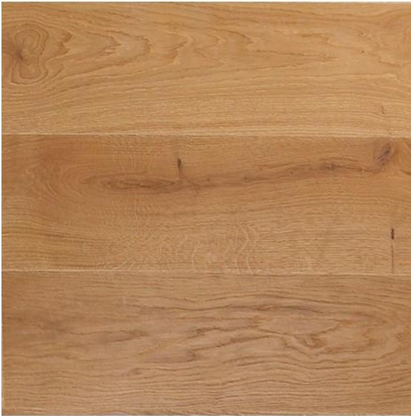
Top 11+12: EICHE-Landhausdielen - geölt