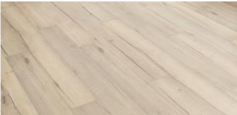
Übrige Top's: Egger Laminat Valley Eiche rauch